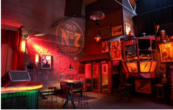
(Toiletteneingänge und DJ Kanzel)